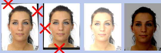
Zwarte/witte randen Te helder/te donker

Ga u gang, MAAR let op dat u geen nieuwe problemen veroorzaakt: